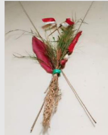
Gambar : Sawen Sunda terdiri dari Sang Saka, Padi, daun hanjuang, rumput palias, cabe merah, bawang putih, bawang merah, haur koneng, lidi pohon kawung.