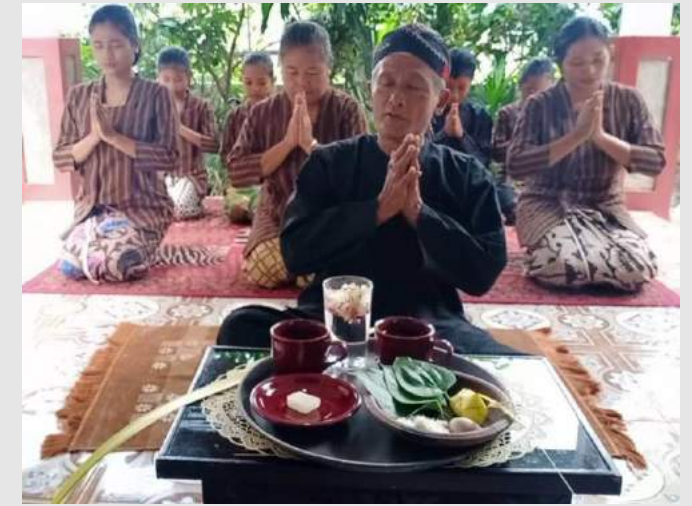
Gambar : “Ritual Tolak Bala” Himpunan Kebatinan Rukun Warga