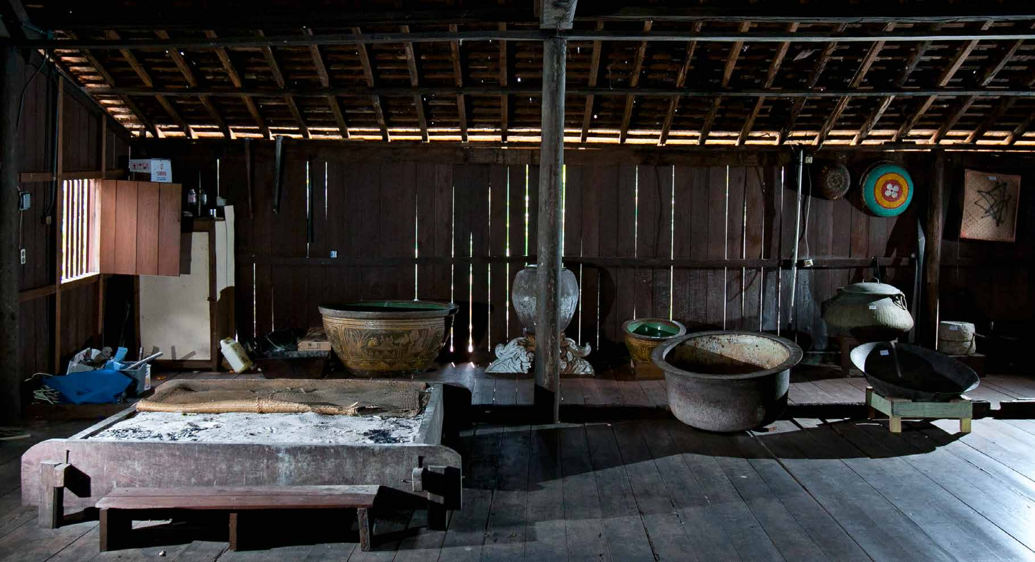
Dapur Utama Istana Pangeran Mangkubumi yang berada dibelakang bangunan utama atau berada ditimur kompleks istana. Ruang dapur utama ini berukuran 12,5 m x 7,8 m. Tampak berbagai koleksi benda memasak tersimpan diruangan ini.