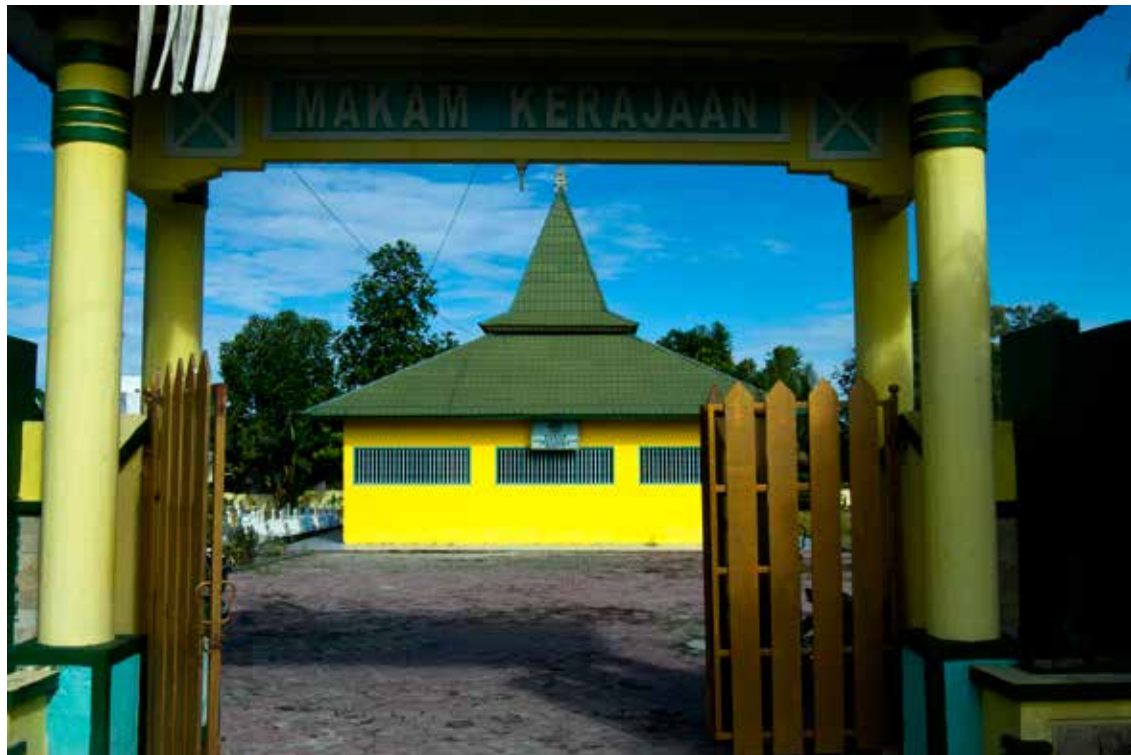
Gubah Kocit yang berada di kompleks Makam Kerajaan dari Kesultanan Kutaringin, sebelah Barat Istana Kuning, Pangkalan Bun. Di dalam Qubba Kocit dimakamkan Pangeran Ratu Anum Kesumayuda, Sultan ke-11 Kesultanan Kutaringin sekaligus pendiri Istana Pangeran Mangkubumi.