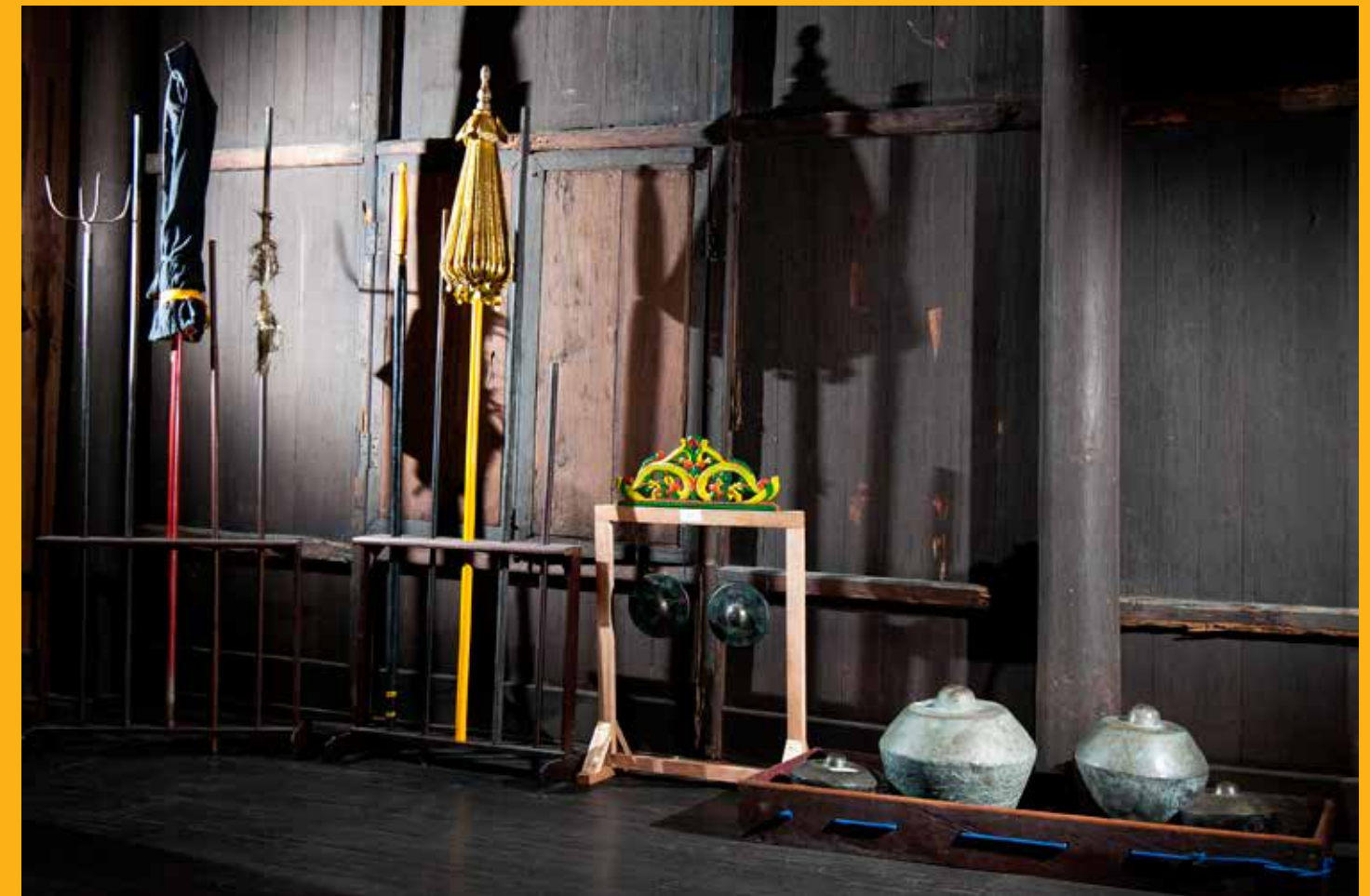
Berbagai tombak, payung dan alat musik koleksi Istana Pangeran Adipati Mangkubumi yang berada didalam Kamar Utama.