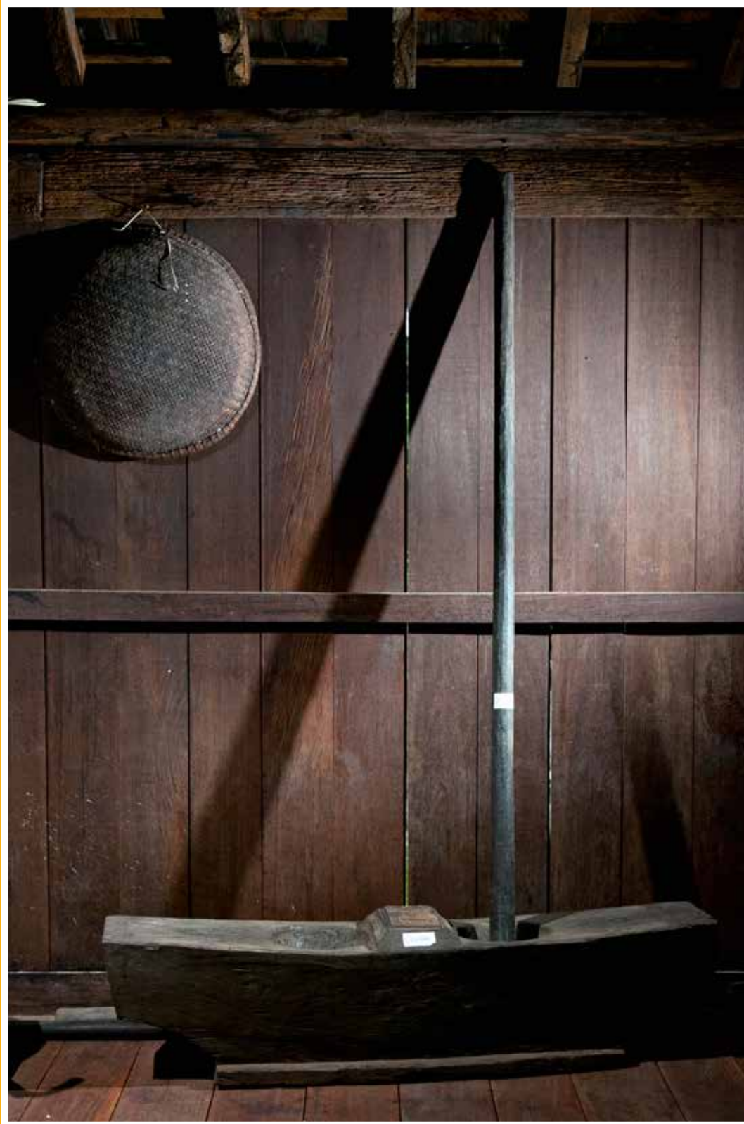
Losung Kayu, lesung terbuat dari kayu yang digunakan untuk menumbuk padi atau rempah-rempah yang merupakan bagian koleksi dari alat-alat memasak di Dapur Utama Istana Pangeran Mangkubumi.