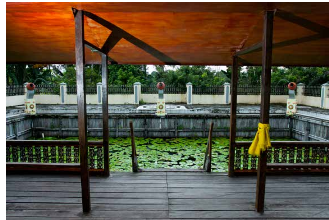
Kolam Pemandian Putri Tujuh. Kolam yang berlokasi kurang lebih 100 meter di selatan Istana Pangeran Mangkubumi ini biasa digunakan oleh sultan, putra maupun putrinya. Kolam ini berukuran 20 m x 30 m dan diberi nama dari jumlah putri Pangeran Adipati Mangkubumi. Kolam Pemandian Putri Tujuh ini adalah hasil renovasi ditahun 2013 oleh Dinas Pekerjaan Umum.