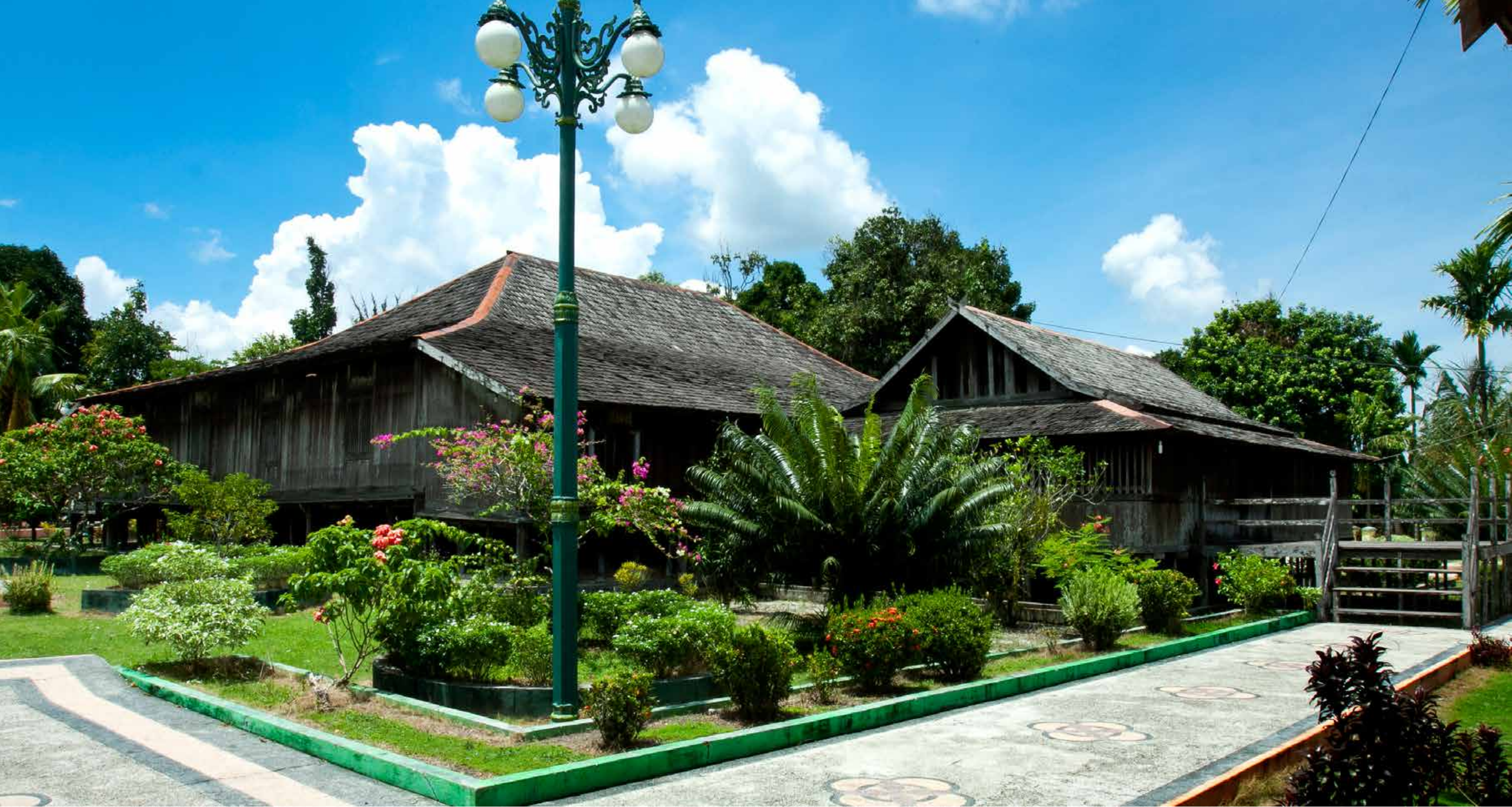
Sisi utara Istana Mangkubumi, tampak taman dan tangga yang menghadap ke utara adalah tangga masuk menuju bangunan pendopo yang didepannya memiliki teras. Tampak pula bangunan utama Istana Mangkubumi yang memanjang kebelakang dengan bentuk atap limasan dari sirap ulin.