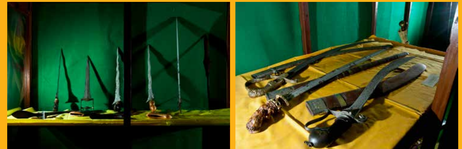
Berbagai macam keris, senjata tajam koleksi Istana Pangeran Adipati Mangkubumi yang diletakkan di dalam lemari di Kamar Utama.