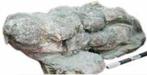
Fosil tengkorak buaya