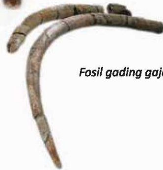
Fosil gading gajah