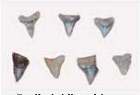
Fosil gigi ikan hiu