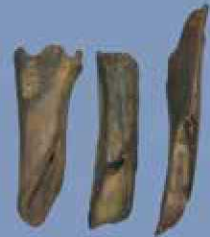
Alat penusuk berbahan tulang