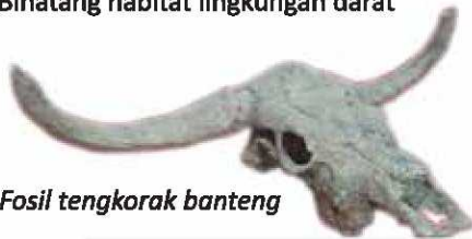
Fosil tengkorak banteng