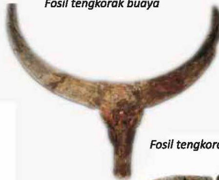
Fosil tengkorak kerbau