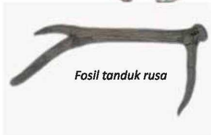
Fosil tanduk rusa