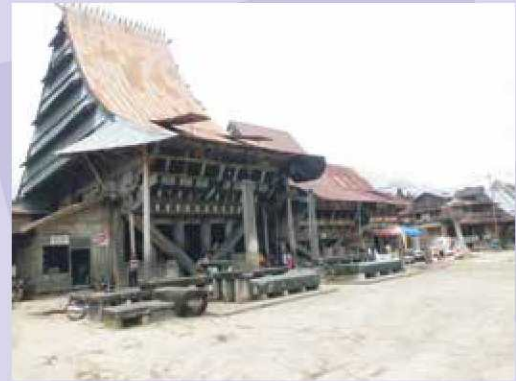
Rumah Kepala Suku/Raja di Nias