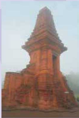
Candi Bajangratu tinggalan budaya masa Hindu-Budha