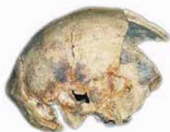
Sangiran 10 (S10)