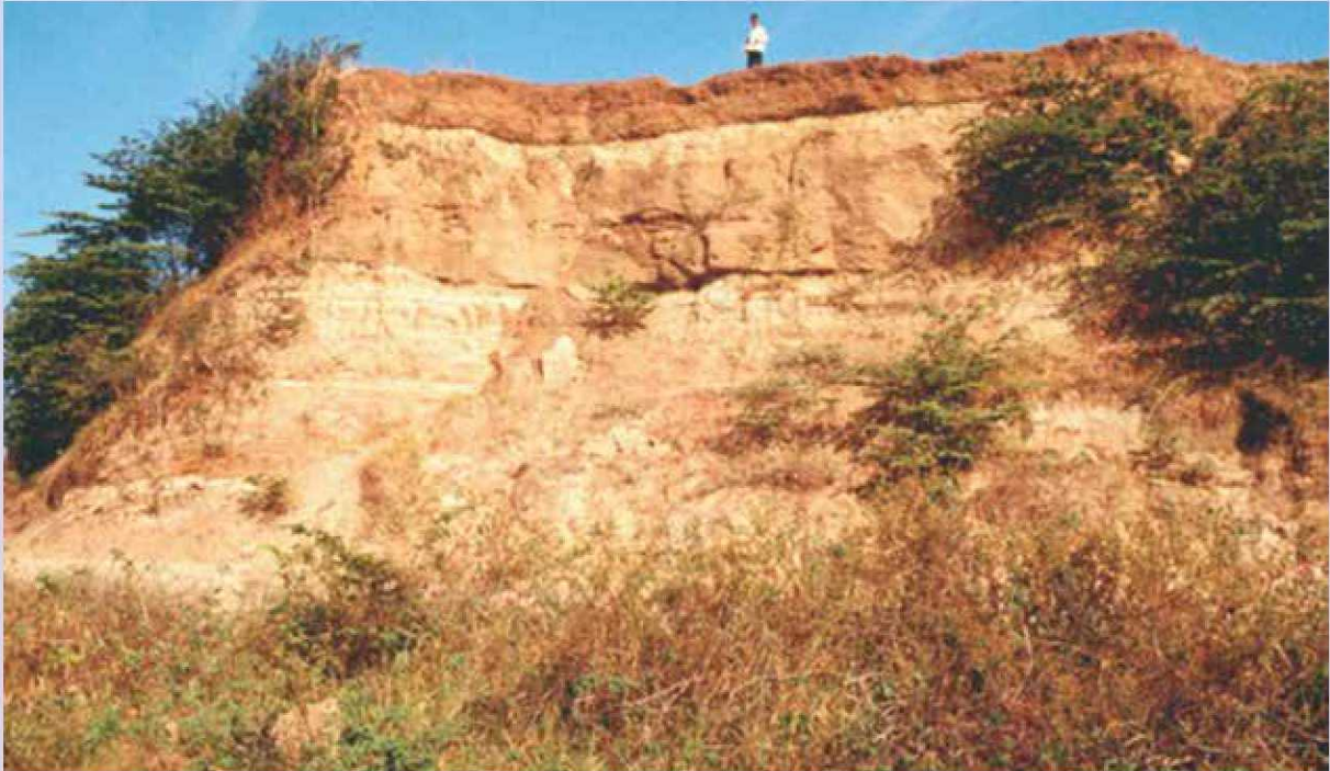
Bagian dari lapisan tanah Situs Sangiran