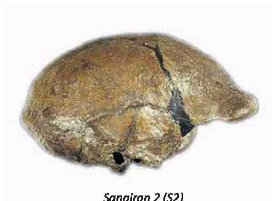
Sangiran 2 (S2)