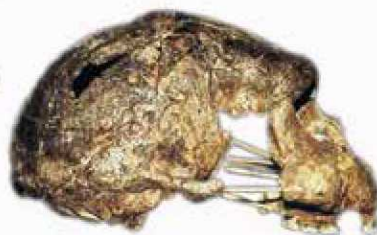
Sangiran 17 (S17)