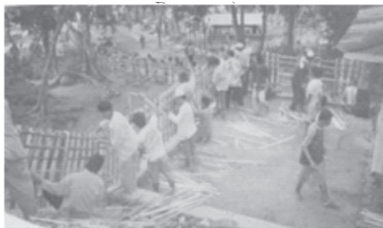
Gb. 3: Gotong royong memasang jaro