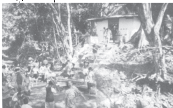
Gb. 1: Jalan menuju makam Mbah Toleh. Tampak anak cucu bergotong-royong mengganti jaro (Foto

Setelah itu, bapak-bapak dan ibu-ibu pulang. Bagi yang masih ingin bermalam di rumah juru kunci atau di Masjid Saka Tunggal, khususnya yang rumahnya jauh, tidur di rumah juru kunci atau di Masjid Saka Tunggal. Mereka pulang pada pagi harinya. Masih ada pekerjaan membereskan tempat, mengembalikan seperti semula, yaitu membongkar tenda dan membersihkan sampah serta mengembalikan gelas, piring, dan perabotan pinjaman. Pekerjaan tersebut dilakukan oleh para pemuda setempat dan