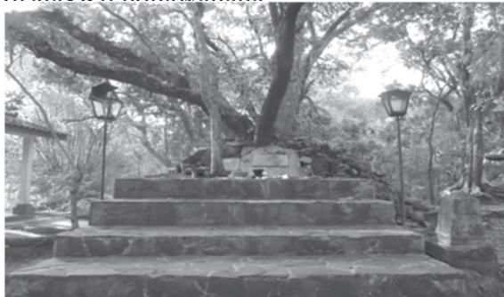
Punden di alas Krendhawahana, Desa Krendhawahana

dipimpin oleh Prabu Sitawaka mengalami wabah maka beliau bertapa di Ngandong Dadapan tempat Brahmana Raji berada. Dalam usahanya mencari pemecahan masalah wabah tersebut ia dibantu oleh Brahmana Raji. Atas saran Brahmana Raji, kemudian Raja Sitawaka melaksanakan Rajaweda dan Gramaweda . Rajaweda adalah sesaji atau selamatan yang dilakukan oleh raja, sedangkan gramaweda adalah sesaji yang dilakukan oleh masyarakat atau rakyatnya. Setelah melakukan upacara selamatan itu ternyata wabah yang menimpa kerajaan Gilingoya hilang. Oleh sebab itu, akhirnya tradisi rajaweda tetap dilaksanakan. Tradisi ini kemudian dilanjutkan oleh Raja Ajipamasa. Adapun tempatnya adalah di alas Krendhawahana. Pada jaman dahulu, ketika penduduk belum padat seperti sekarang, alas Krendhawahana merupakan sebuah hutan yang lebat dan dianggap keramat. Peng-keramatan itu semakin kuat ketika dibalut dengan mitos penguasa makhluk halus yang merupakan jelmaan dari Batari Durga (dalam cerita pewayangan) atau Dewi Kalayuwati. Pusat kerajaan makhluk halus itu sekarang berupa punden yang berada di bawah pohon beringin di alas Krendhawahana.