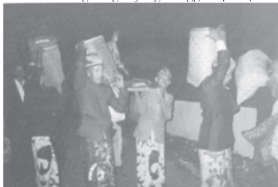
Gb. 2 Munjung (menyumbang) untuk keperluan Selamatan Jaro Rojab (Foto koleksi Disparbud Kab.