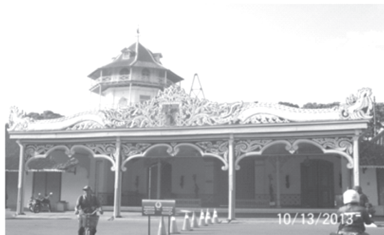
Keraton Surakarta Sri Manganti

pada tanggal 7 bulan Syawal; (7) Bulan Besar. Upacara Grebeg Besar, unsur utamanya adalah gunungan. 4