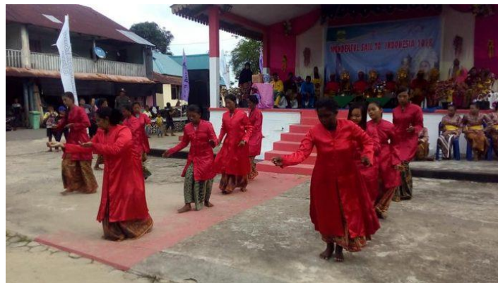
Gambar 2. Tampilan tari merawai tahun 2018 di Desa Penuba.