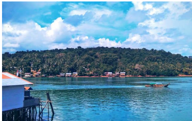
Gambar 1. Pulau Lipan, Desa Penuba, Kabupaten Lingga

berbatasan dengan Pulau Mepar. Pulau terdekat yaitu Selayar yang jaraknya hanya sekitar tujuh menit naik sampan. Kedua pulau dipisahkan Selat Penuba. Keadaan Pulau Lipan berbukit-bukit dan daerah pantainya jarang yang landai. Kondisi daerah yang perbukitan menyebabkan air bersih cukup sulit di daerah ini. Namun, ada satu sumur yang dimanfaatkan oleh warga. Air sumur itu tawar dan bersih. (Kadir, dkk, 1985:40). Penduduk Pulau Lipan adalah orang laut. Orang laut sendiri dari berbagai suku kecil dan yang tinggal di Pulau Lipan adalah Orang Barok. Orang Barok yang ada di Pulau Lipan berasal dari Desa Sungai Buluh, Kecamatan Singkep Barat. Jarak dari Pulau Lipan ke Sungai Buluh bisa ditempuh dalam waktu 30 menit pakai speedboat atau satu setengah jam menggunakan sampan dayung.