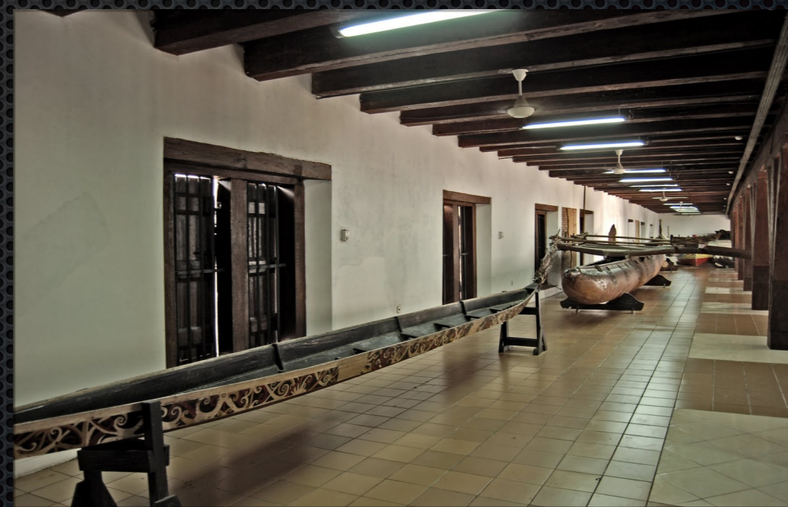
"Sunyi Sendiri", berbagai sumber: 2010-2015