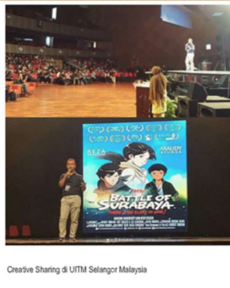
Creative Sharing di UiTM Selangor Malaysia