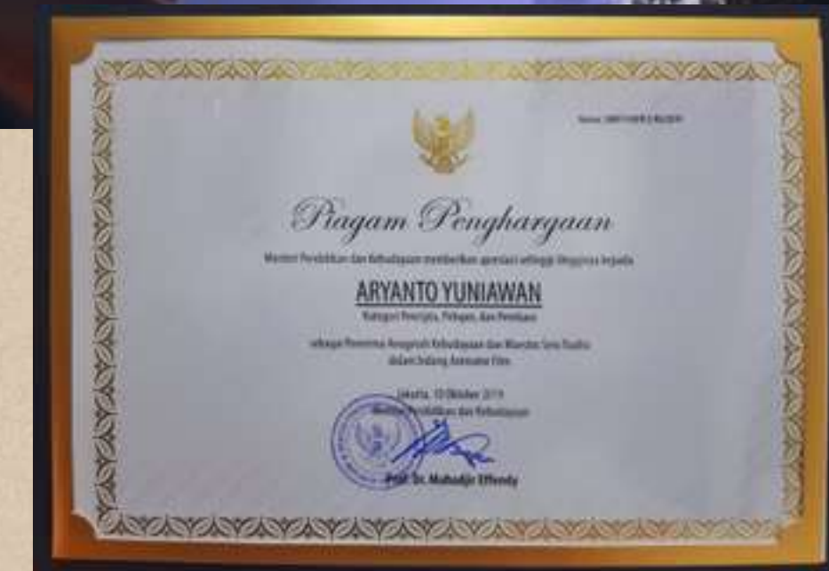
Penghargaan Tokoh Pelopor, Pencipta, dan Pembaru Anugerah Kebudayaan dan Maestro Seni Tradisi dalam bidang Animator Film 2019