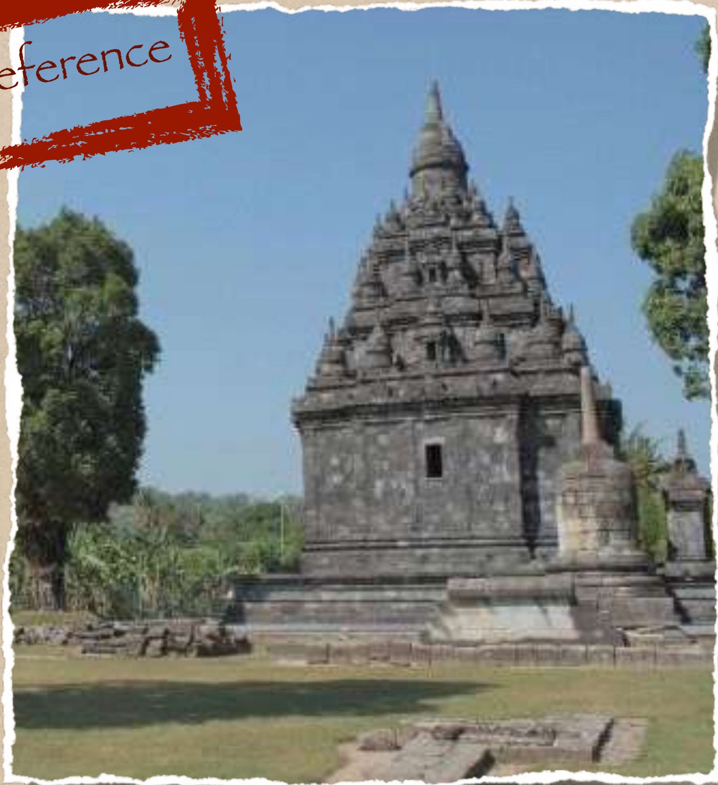
Candi Sojiwan, acculturation of Hindu & Buddha, Ancient Mataram