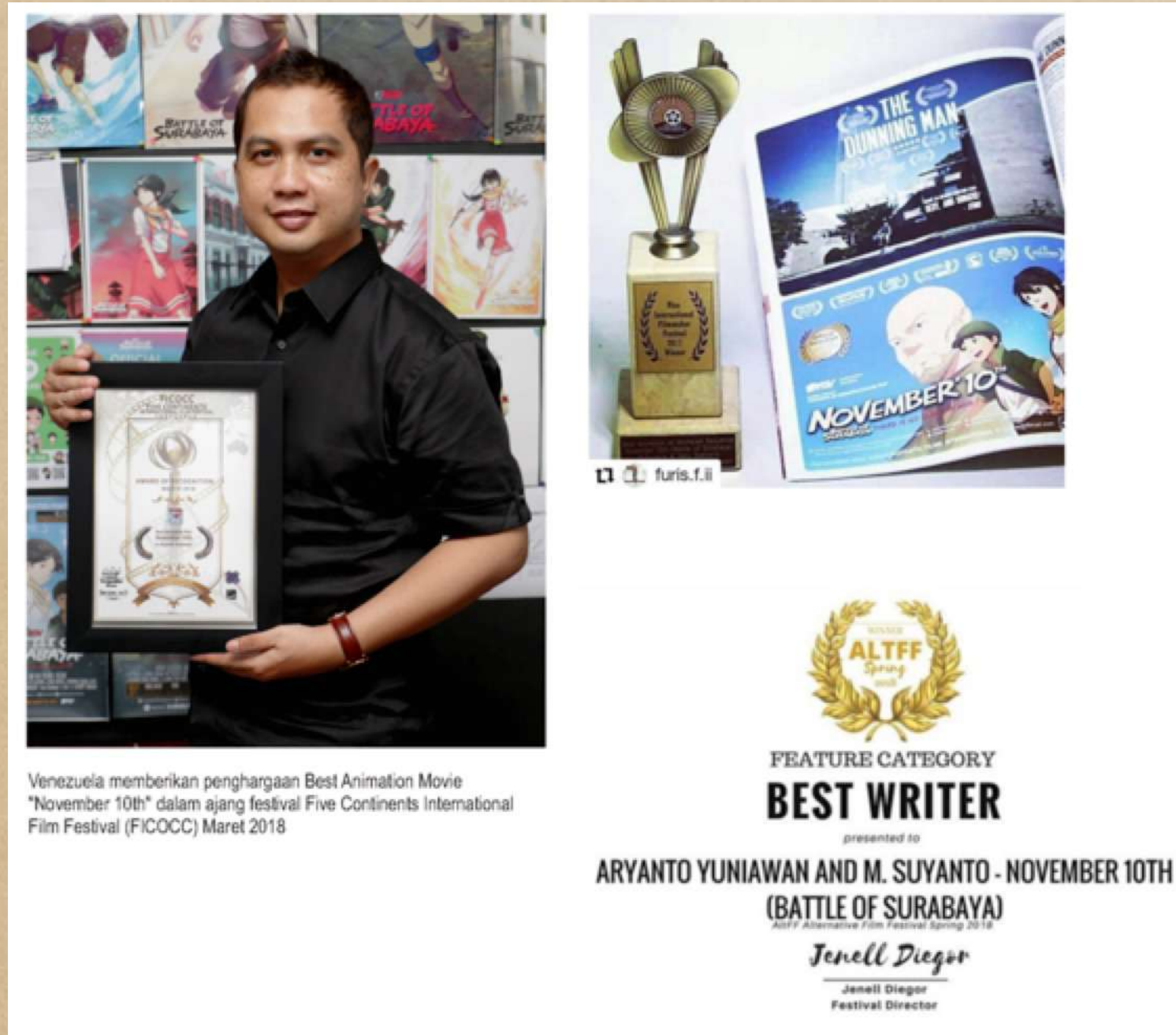
Best Writer Film Battle of Surabaya, Alternative Film Festival 2018, Toronto, Canada.

39 International Awards Film Battle of Surabaya as a Producer, Scriptwriter & Director