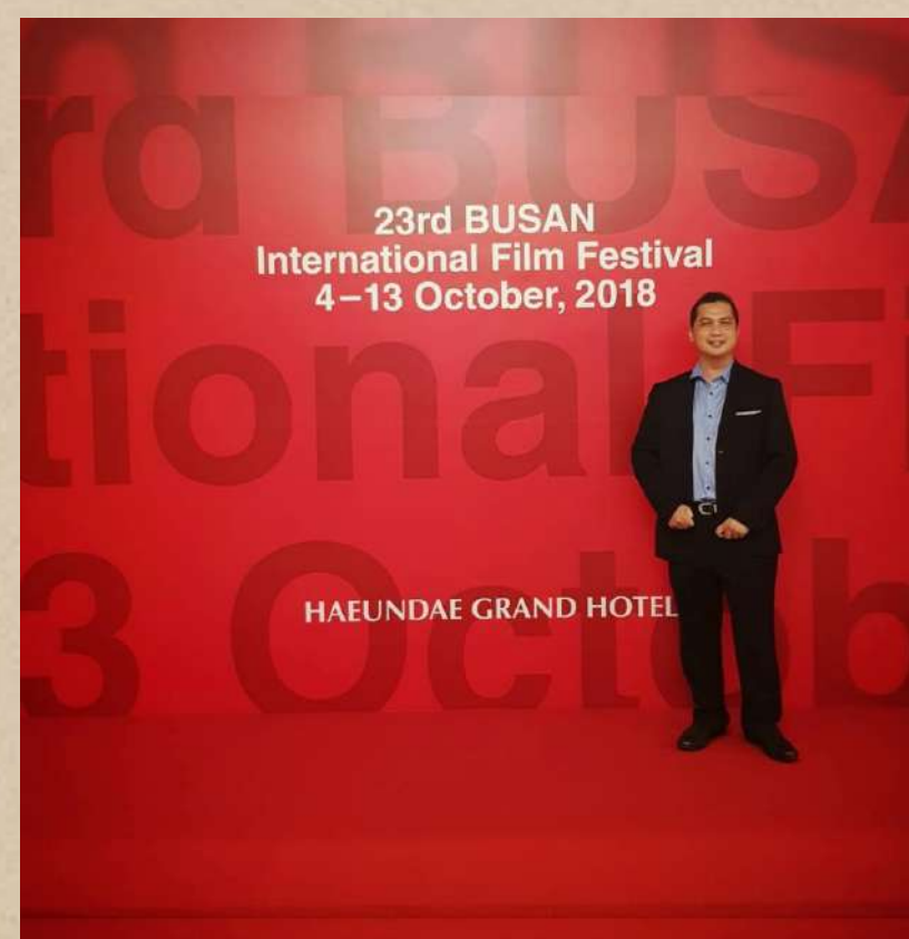
Guest Speaker at Korea Animation Producers Association (KAPA), Busan, Korea 2018