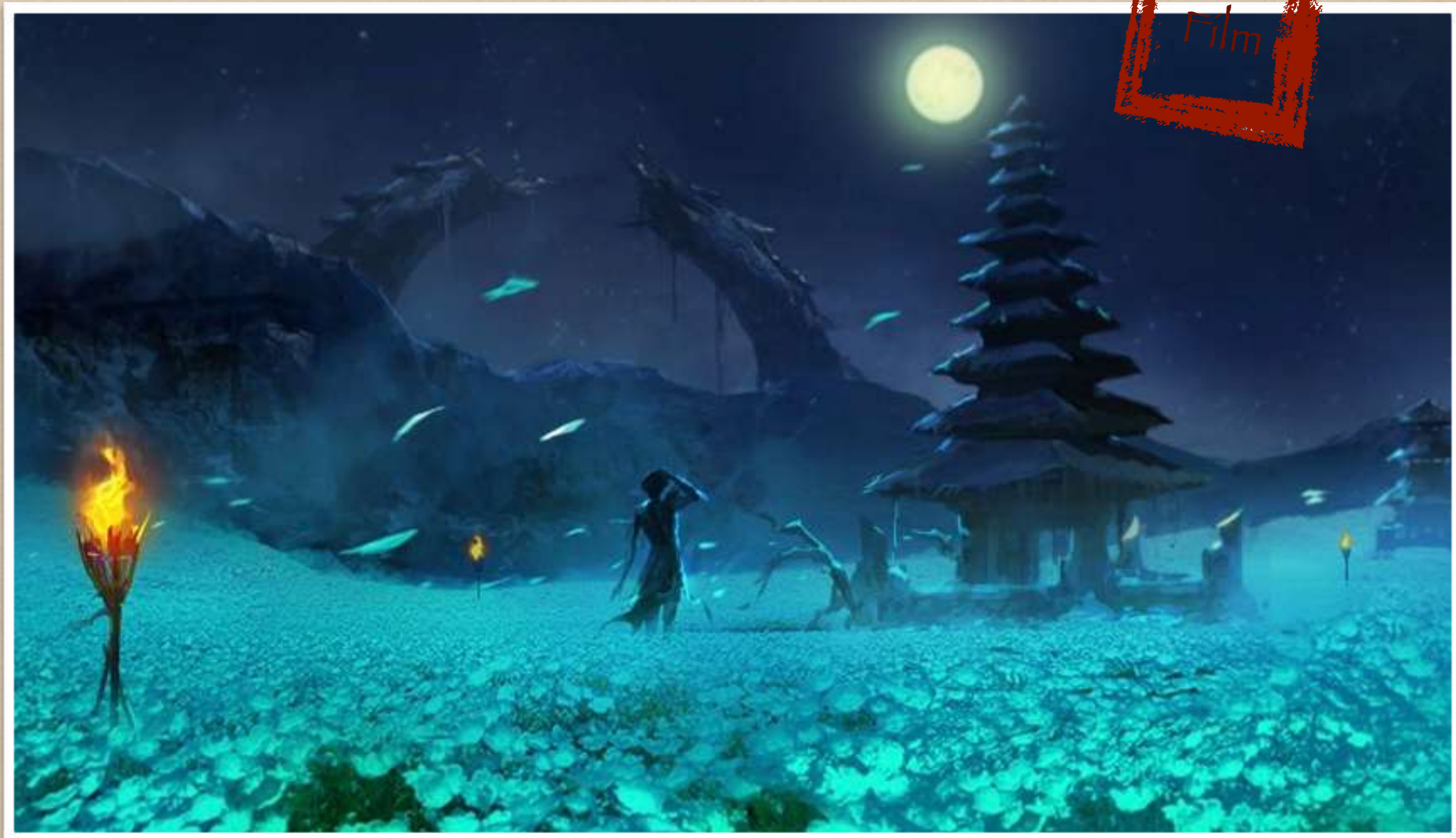
Concept Art Medang - Immortal Flower Field