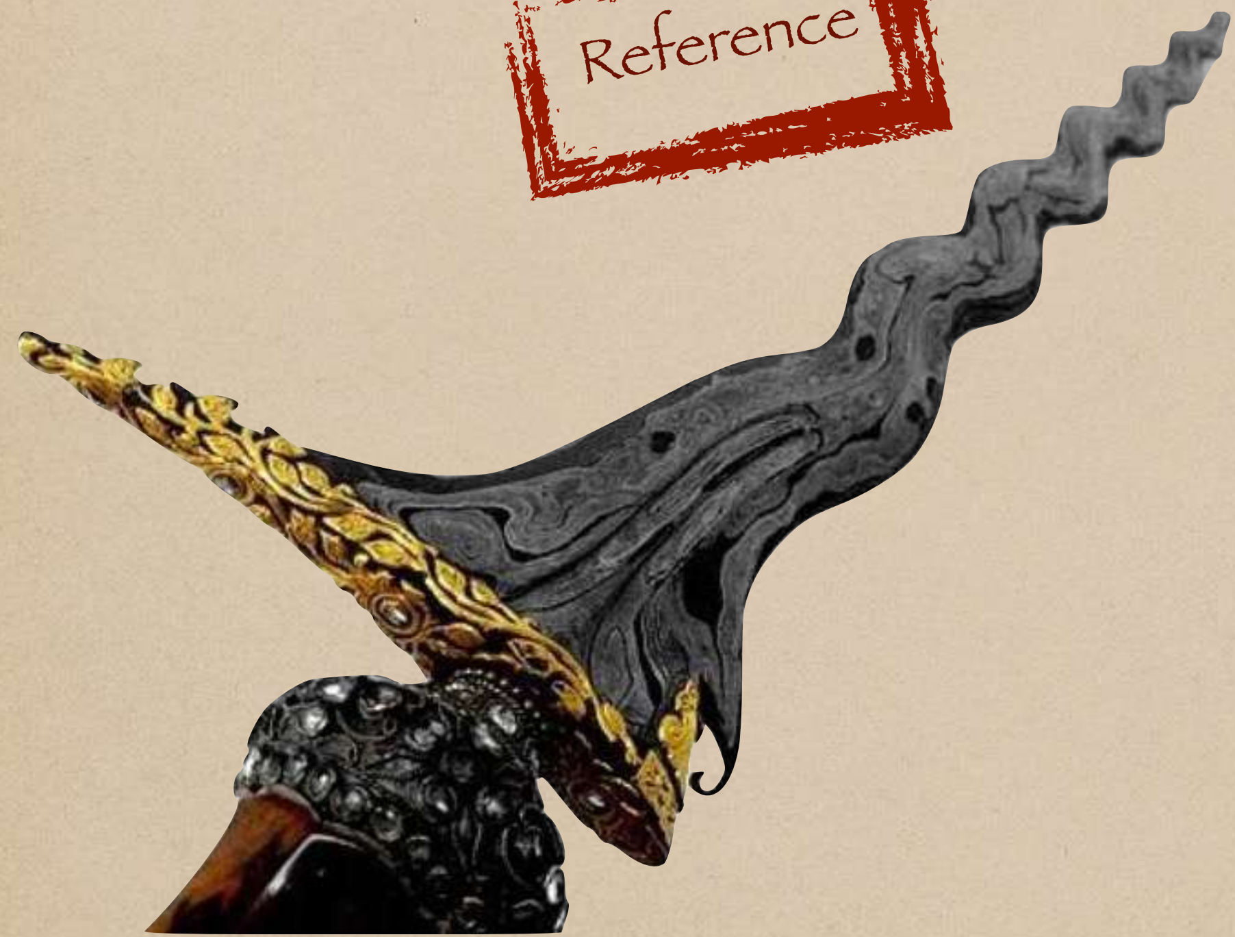
Keris Mpu Gandring