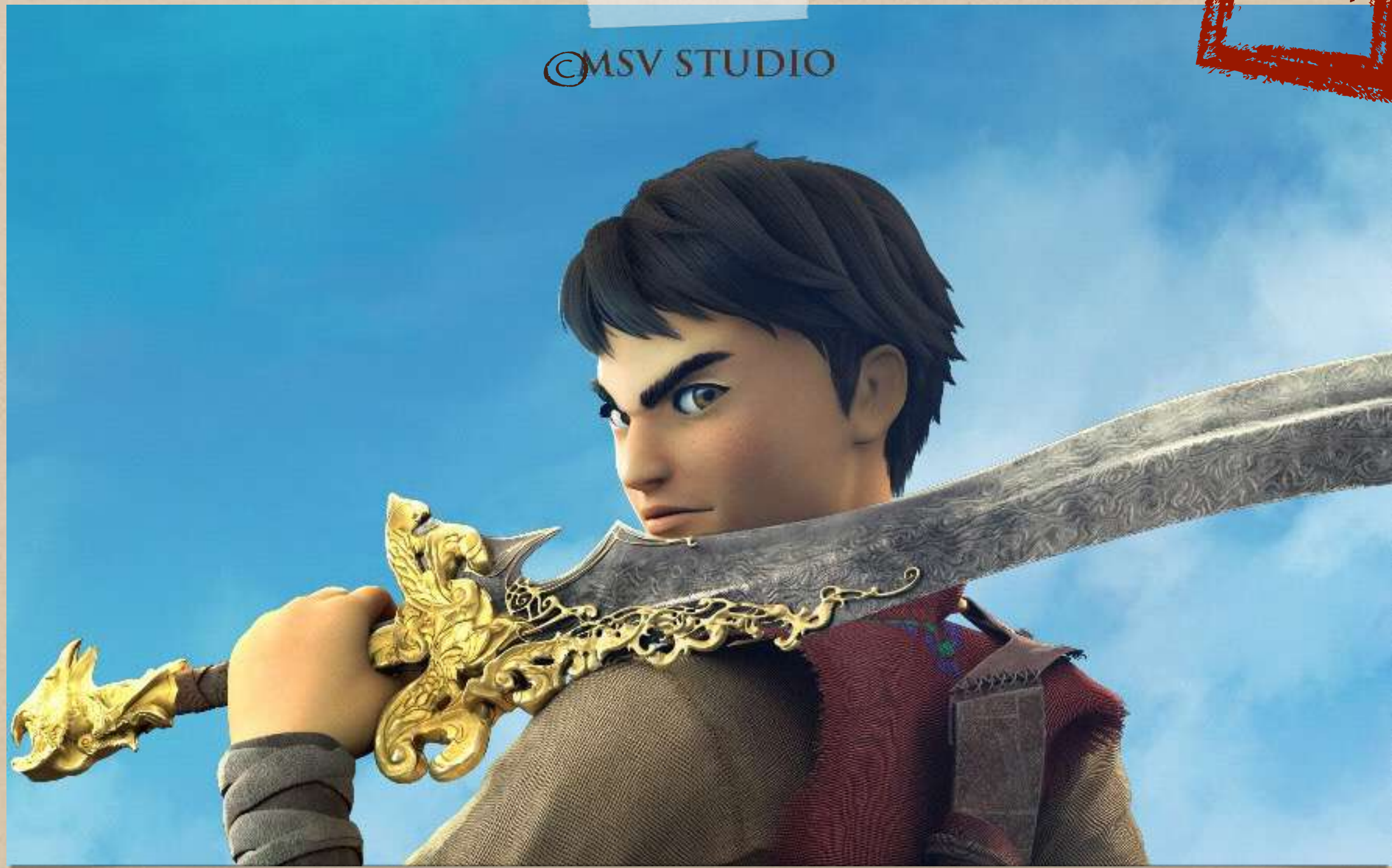
Pedang Ajisaka memiliki dasar bentuk dari keris