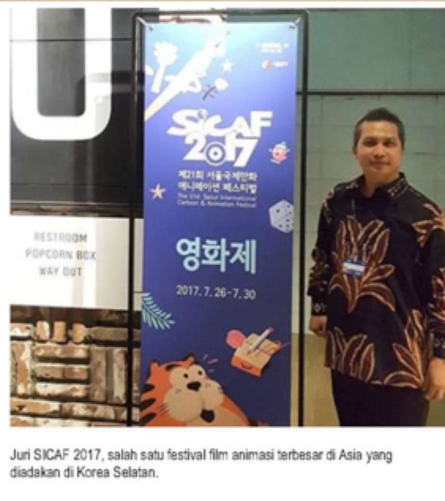
International Jury Korea