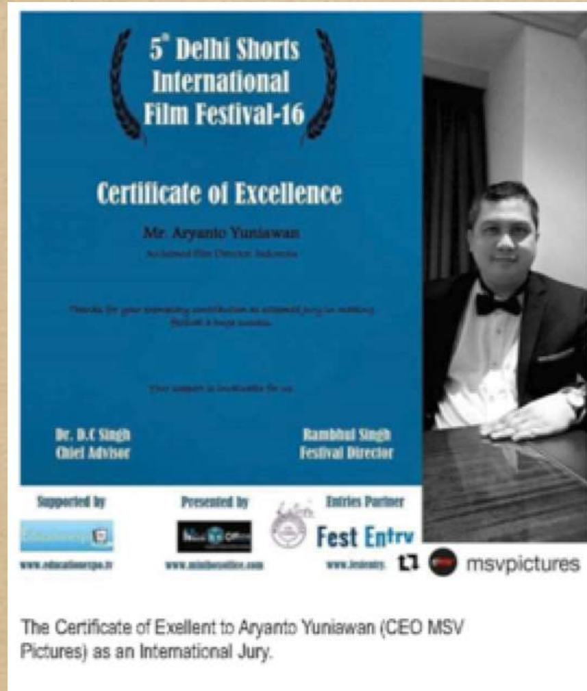
International Jury India