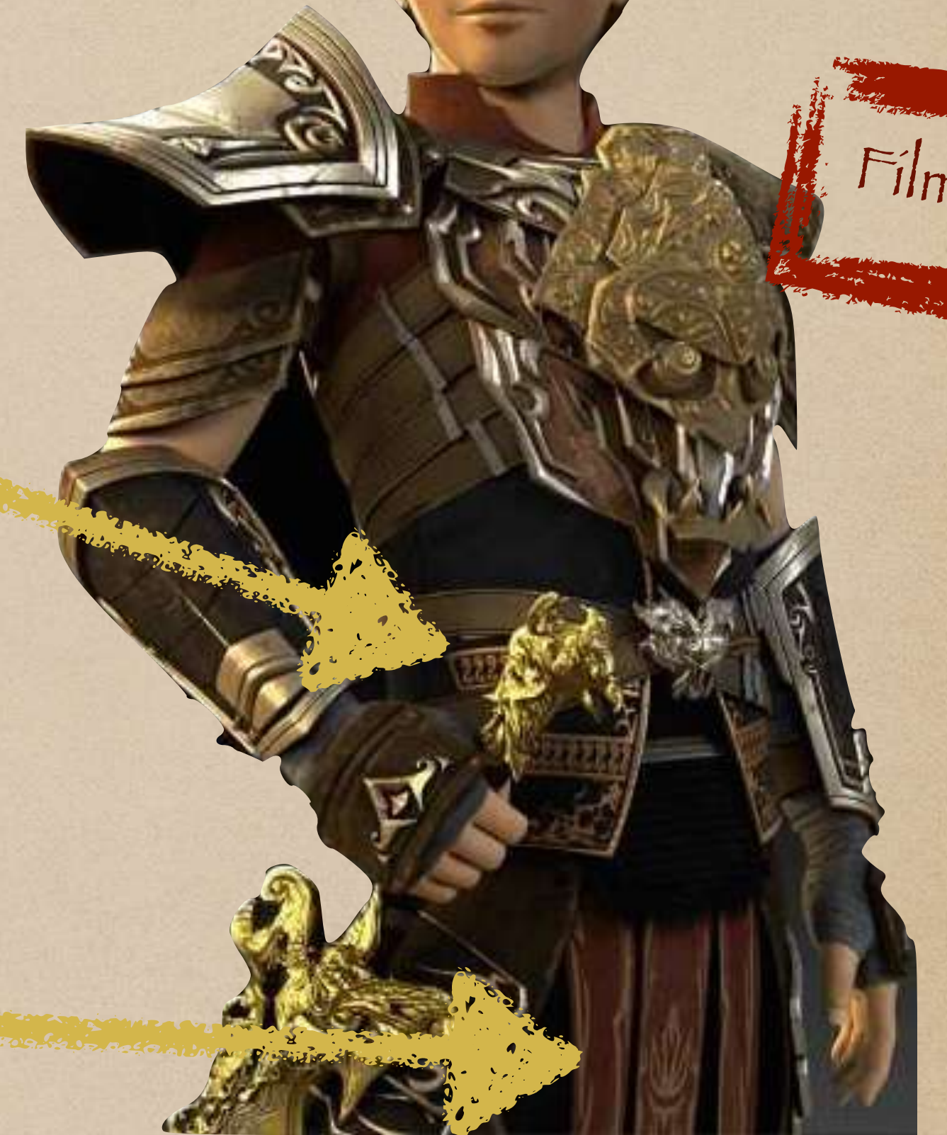
Wardrobe Ajisaka: adaptasi baju armor dari Tiongkok dinasti Tang, perpaduan dengan ukiran motif nusantara dari Kutai dan Mataram Kuno (Jawa)

https://www.senibudayasia.com/2016/10/simbol-ornamen-ukir-suku-dayak-ngaju.html