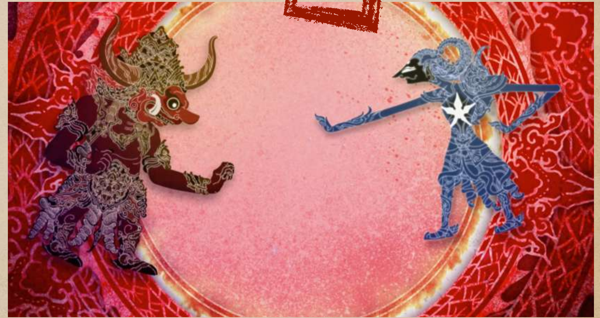
Opening Scene Film Hikayat Ajisaka