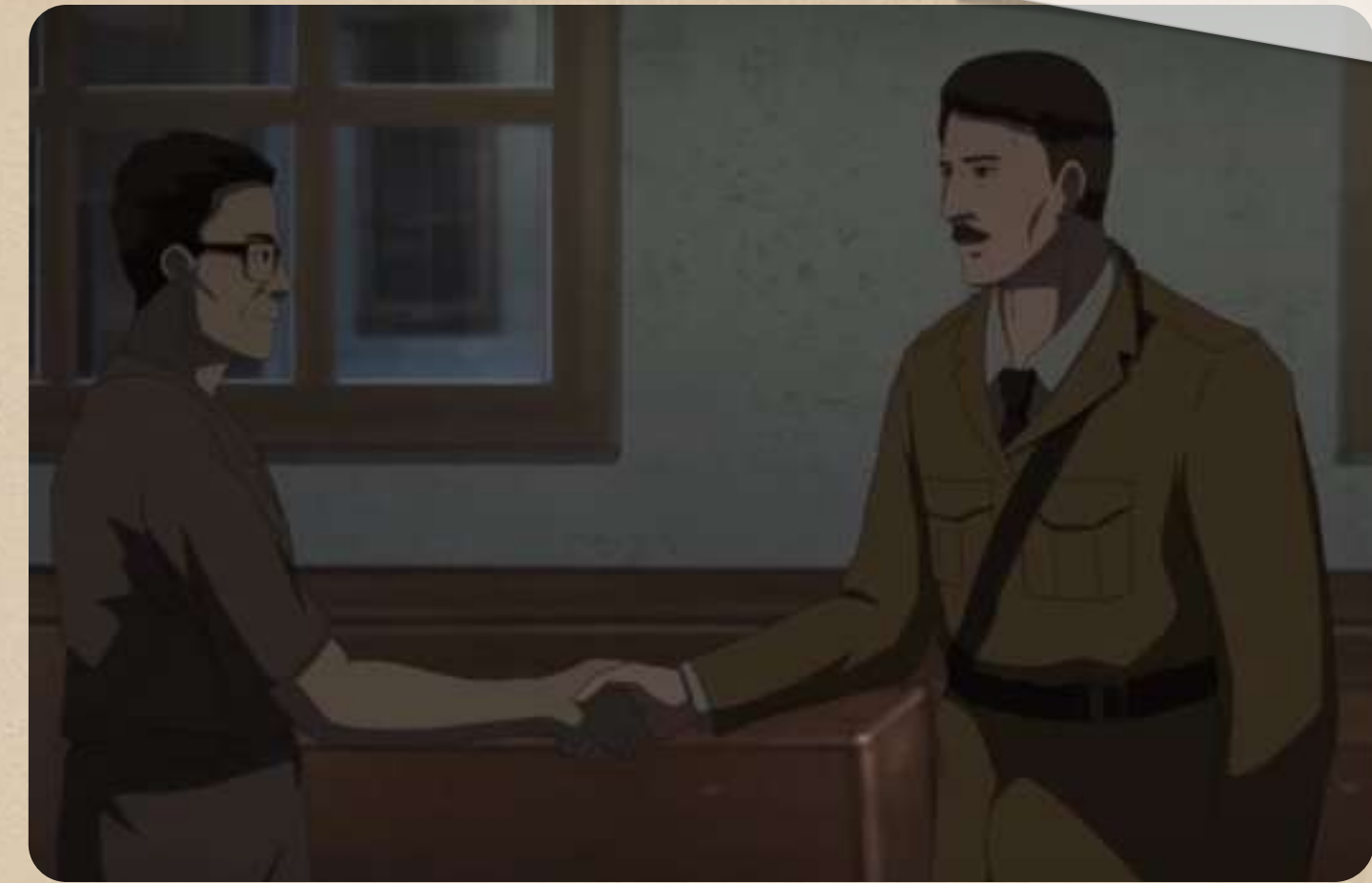
Residen Soedirman & Jend. Mallaby