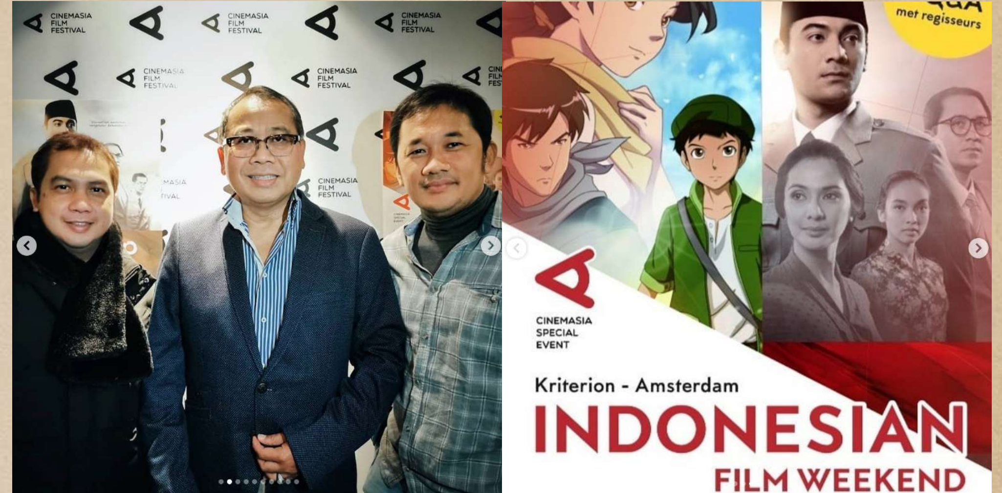
Q&A Indonesian Film Weekend di Amsterdam, Belanda