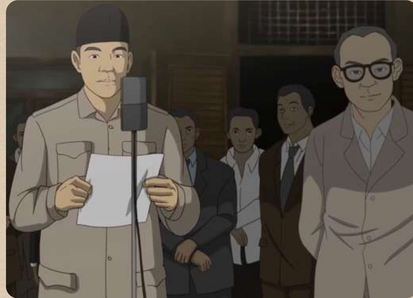
Soekarno & Hatta