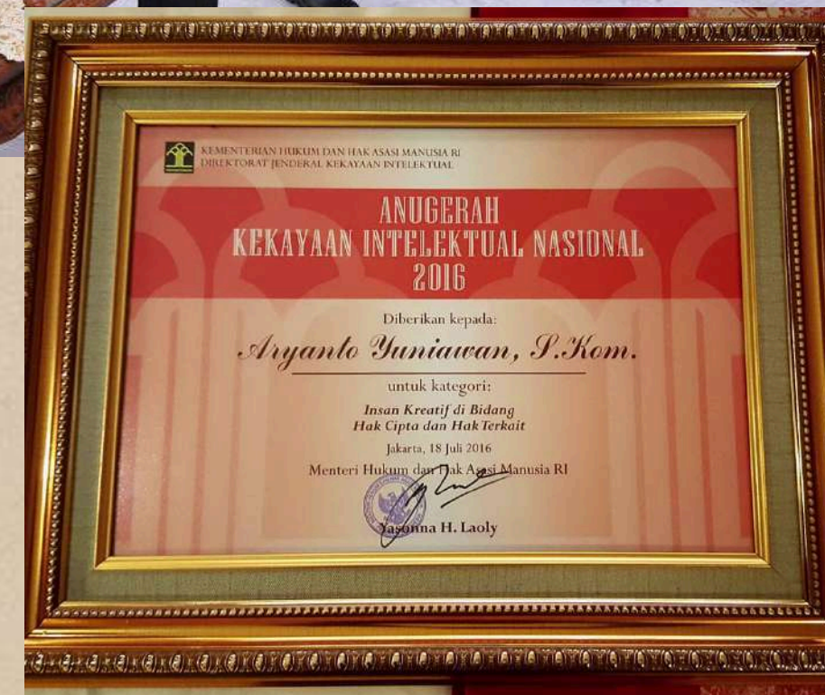
Penghargaan Anugerah Hak Kekayaan Intelektual Nasional 2016