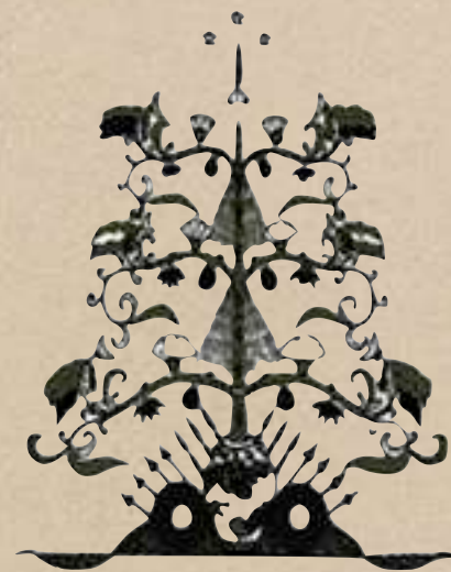
Batang Garing, melambangkan Ketuhanan

https://blogunik.com/berbagai-macam-motif-batik-dan-asalnya/