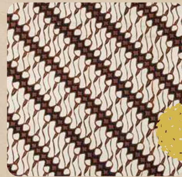
Motif Parang dari Jawa, Melambangkan Kesinambungan

https://blogunik.com/berbagai-macam-motif-batik-dan-asalnya/