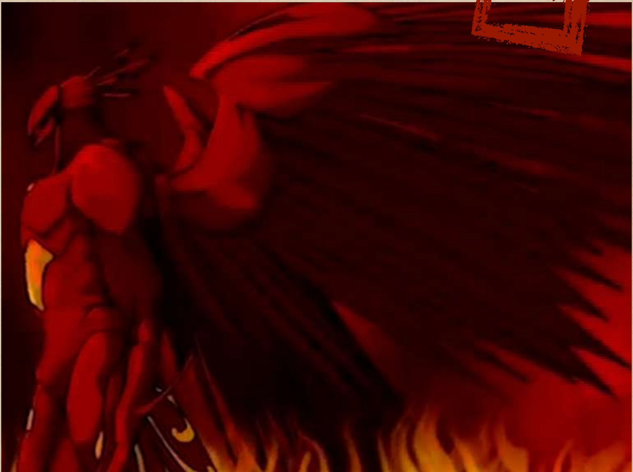
Opening Scene Film Jatayu