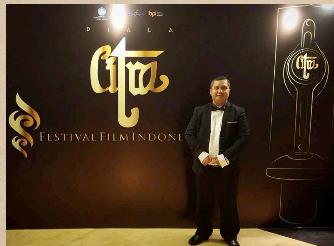
Juri FFI 2016