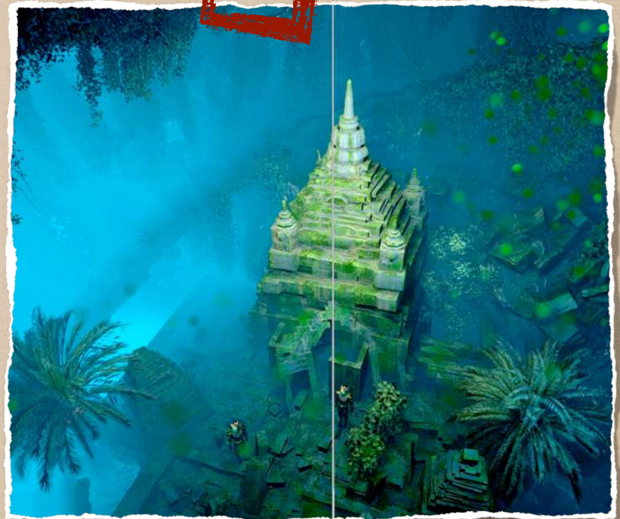
Concept Art Medang Cave