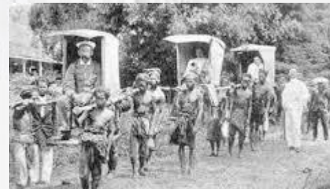
Zaman feodal.