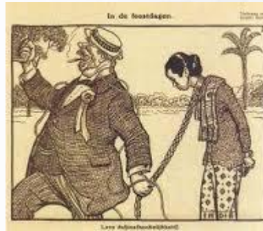
Zaman perbudakan.