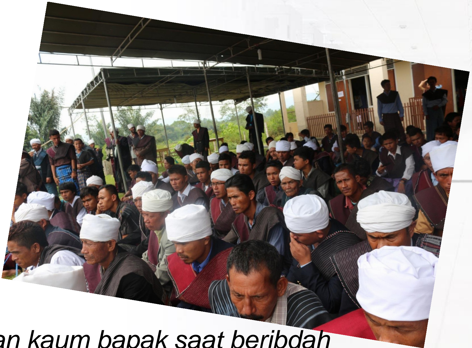
Pakaian kaum bapak saat beribadah