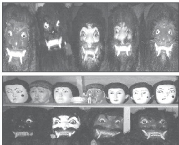
Foto 2. Topeng Dongkrek Dulu (atas) Topeng Dongkrek Sekarang (bawah) Sumber: Dokumen penulis, 2012

Penggambaran ini, dalam model berpikir orang Jawa di atas (bagan I), berada dibidang III tempat hal-hal yang bersifat materi, duniawi, lahiriyah dan nafsu-nafsu didewakan. 29 Namun ada keinginan bagi manusia untuk meninggalkan semua itu dalam rangka mencari keharmonisan dan ketenteraman dalam dunia batinnya. Keinginan seperti itu digambarkan melalui bidang IV, yang dalam kesenian dongkrek digambarkan dengan nenepi (tapa) untuk mencari kasekten guna mengusir pageblug . Berdasarkan simbol-simbol tersebut, kesenian ini ingin menyampaikan pesan bahwa manusia harus mampu mengendalikan nafsu-nafsu lahiriyahnya, agar tidak menjadi buta/raseksa , atau seperti hewan ménthog (cairina moschata) , karena bencana ( pageblug ) akan dapat menyimpannya jika dirinya tidak mampu mengendalikan hawa nafsunya.