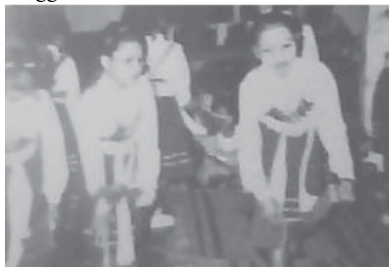
Gambar 2. Para Penari Dames dalam Gerak Tancep Alusan

Pola lantai garis lurus dalam Tari Dames mempunyai makna kuat, tegas, dan sederhana yang menandakan penanaman ketauhidan seseorang. Makna yang terkandung dari pola lurus dalam Tari Dames adalah makna manunggal atau menyatu yang berarti satu tujuan keyakinan dalam menganut ajaran agama dan menyembah satu Tuhan yaitu Allah SWT. Garis lurus itu juga diibaratkan huruf Arab yang pertama yaitu Alif . Alif diartikan sebagai lambang jejeg , jujur, tegak, kukuh. Artinya melaksanakan perintah Allah SWT sesuai Al-Quran dan Hadits secara konsekwen, tidak menyimpang, lurus dengan bersungguh-sungguh.