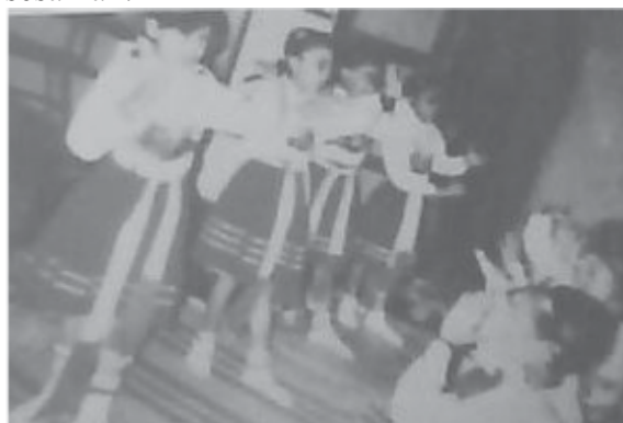
Gambar 1. Para Penari Dames dalam Gerak Jengkang Tancep

Gerakan-gerakan dalam Tari Dames mengikuti dan menyesuaikan irama musiknya, tidak mempunyai maksud tertentu seperti dalam tari klasik. Gerakan-gerakannya sangat memperhatikan etika kesopanan dan kepantasan sebagai wanita Jawa, hal itu terlihat dalam setiap gerakannya. Tidak ada gerak loncat atau gerak yang membutuhkan langkah-langkah lebar serta mengangkat kaki tinggi-tinggi meskipun dalam Tari Dames ada unsur bela dirinya. Pola lantai dalam Tari Dames berupa melingkar, garis lurus vertikal, dan garis lurus horizontal. Pola lantai melingkar mengisyaratkan “kebersamaan dan mengandung maksud menuju kepada Tuhan Yang Maha Esa”. Pola lantai lurus vertikal mengandung makna “kuat, tegas, dan sederhana serta mengandung maksud manunggal atau menyatu dalam satu keyakinan dan menganut ajaran agama yaitu Islam”. Pola lantai lurus horizontal mengandung makna “kesejajaran bahwa hidup memiliki derajat sama dan tidak bisa dipaksakan masalah keyakinan, tetapi harus selalu menjaga hubungan baik dengan sesama”.