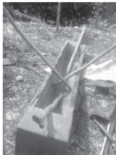
Gambar lesung dan alu

Masa panen bagi masyarakat agraris merupakan sebuah perayaan sehingga aktivitas panen dijalankan dengan segala kegembiraan. Sembari bekerja merontokkan padi para perempuan memainkan kothekan lesung , penuh semarak dan gembira menjadi pemandangan umum selama masa panen. Selain sebagai alat penumbuk padi, awalnya kothekan lesung juga digunakan untuk