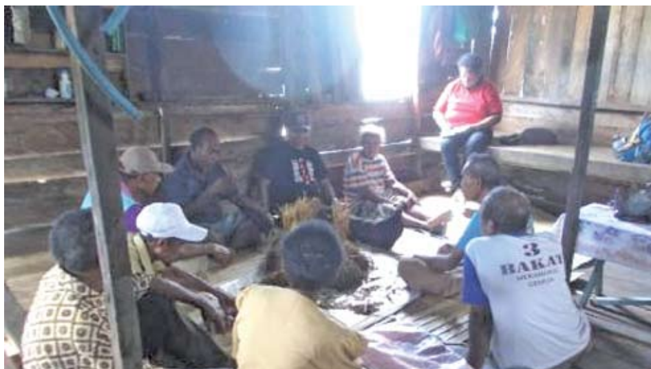
Kegiatan FGD di Kampung Baruki, Numfor Barat Dokumentasi Tim : September 2013