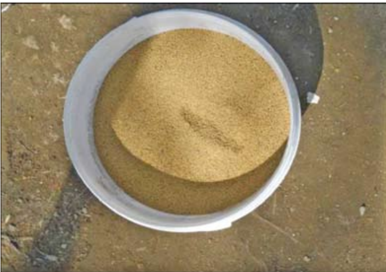
Pokem yang sudah siap dikonsumsi Dokumentasi Tim : Agustus 2013