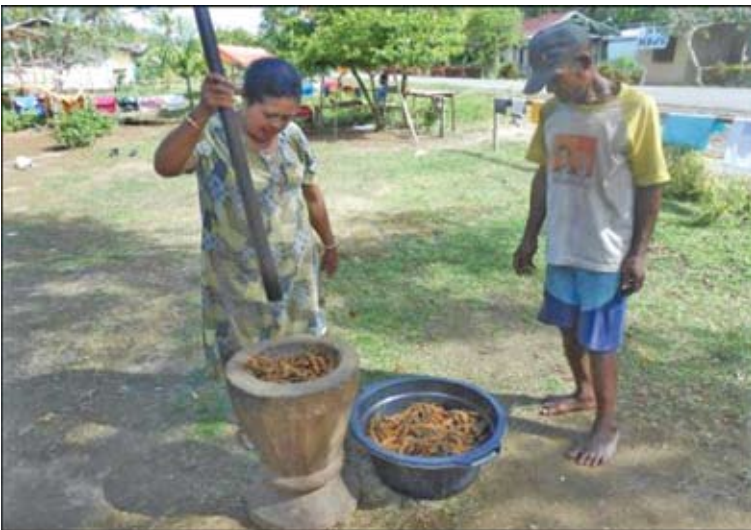
Proses penghalusan dengan cara ditumbuk Dokumentasi Tim : Agustus 2013