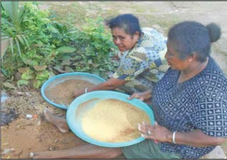
Proses memisahkan ampas dan biji pokem Dokumentasi Tim : Agustus 2013