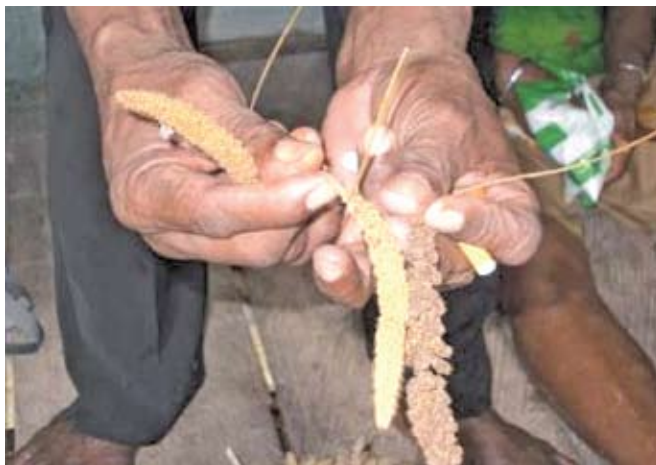
Gambar 8: Tiga jenis Pokem berdasarkan warnanya

Tinggi tanaman pokem adalah berkisar 2 meter, merupakan tanaman pokem yang siap dipanen. Hal ini sama dengan yang dijelaskan oleh Malik dan Dimara dalam penelitian mereka (Malik; 2008, Dimara; 2008) 17 , bahwa pokem dikenal sebagai tanaman lokal dan tumbuh secara khusus di Pulau Numfor, yang termasuk dalam kelompok tanaman sereal. Malik & Dimara menyatakan bahwa orang Numfor mengidentifikasi pokem berdasarkan warna, yaitu pokem merah, pokem putih, dan pokem hitam.