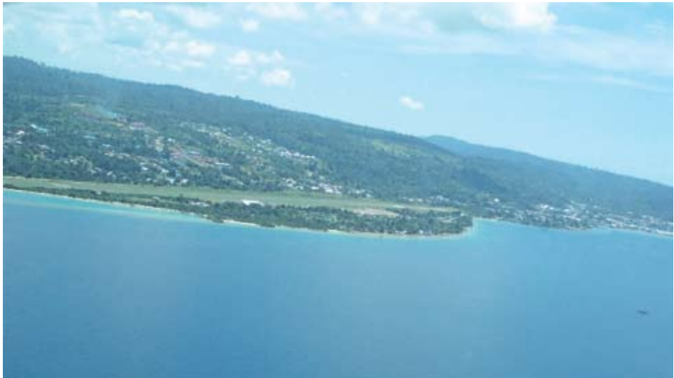
Bandara Rendani, Manokwari Dokumentasi Tim : Agustus 2013