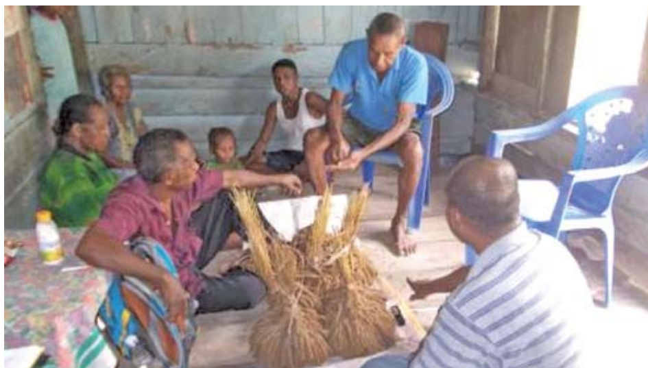
Tim penelitian melakukan wawancara informan di Kampung Yenburwo Dokumentasi Tim : Agustus 2013