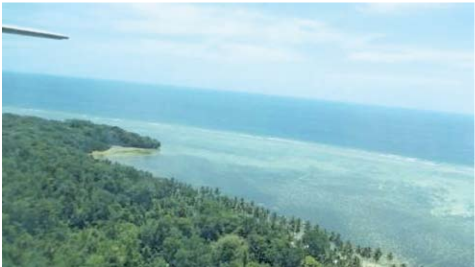
Saat pesawat hendak mendarat di bandara Yenburwo, distrik Numfor Timur Dokumentasi Tim : Agustus 2013