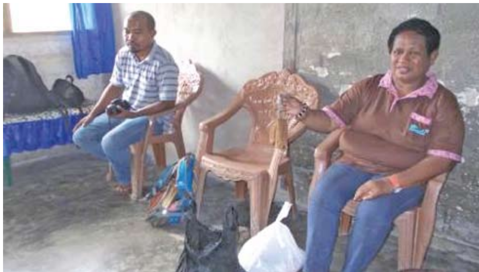
Tim penelitian merencanakan kegiatan FGD & wawancara informan Agustus 2013