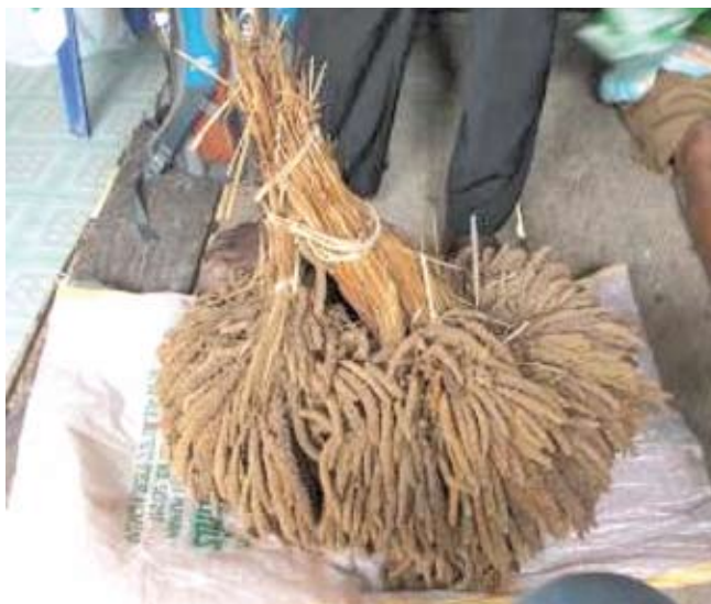
Gambar 9: Pokem sejumlah 1 kanar (kurang lebih 3 kg)

juga dengan luasnya lahan yang akan ditanami pokem . Bisaanya luas satu lahan atau kebun pokem yang akan ditanami adalah kurang lebih 2 hektar.