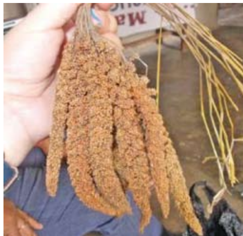
Gambar 7: Pokem yang telah dipanen beberapa bulan sebelumnya Sumber : Dokumentasi Tim Penelitian BPNB Jayapura, Agustus 2013

ini memerlukan dukungan pemerintah dalam pengembangan tanaman pokem ini guna memperkaya sumberdaya pangan alternatif dalam rangka memperkuat ketahanan pangan di negeri ini (BPTP Papua 2008). Keistimewaan dari pokem adalah mengandung vitamin C dan D. Selain itu pokem juga mengandung mineral makro maupun mikro yang unggul, kecuali pada kadar vitamin B6 dan B12 (Rumbrawer 2003). Kandungan vitamin A yang sangat tinggi inilah yang menjadi keunggulan pokem dibandingkan dengan jenis tanaman sereal lainya. Kandungan vitamin A tersebut terlihat dari kandungan karotenoidnya. Bagi masyarakat Numfor, mereka mengenal lima jenis tanaman pokem yang terdiri atas; pokem vesyek atau pokem coklat, kedua pokem verik atau pokem merah, ketiga pokem vepyoper atau pokem putih, keempat pokem vepaisem atau pokem hitam, dan kelima pokem venanyar atau pokem kuning. Diketahui bahwa pokem merah menunjukkan adanya zat warna karotenoid. Pigmen karotenoid memiliki fungsi utama sebagai antioksidan dan penangkal radikal bebas yang sangat potensial, misalnya dalam menurunkan resiko kanker dan penyakit kardiovaskuler (Haila 1999; Rahmalia & Karwur 2008) 16 .