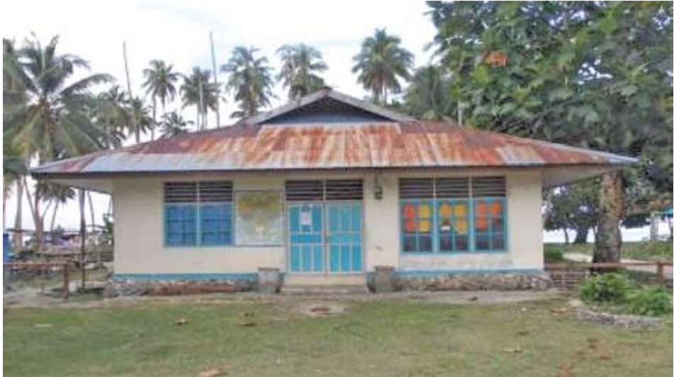
Penginapan ( Indaismuren ) Tim Penelitian di Yenburwo, Numfor Timur Dokumentasi Tim : Agustus 2013