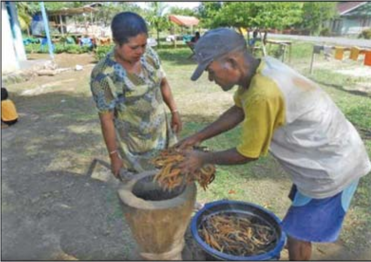
Proses penghalusan dengan cara ditumbuk Dokumentasi Tim : Agustus 2013