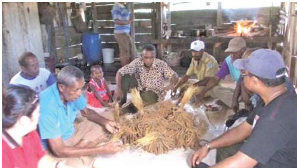
Kegiatan FGD di Kampung Baruki, Numfor Barat September 2013