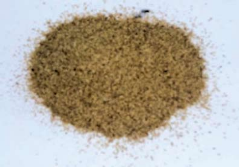
Pokem yang sudah siap dikonsumsi Agustus 2013