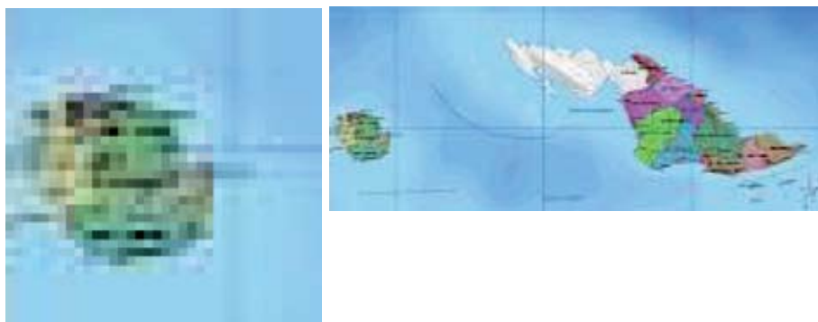
Gambar 5: Peta Pulau Numfor & Kabupaten Biak Numfor

pihak Jepang membangun dua lapangan terbang militer; di Namber dan Kameri. Pada masa Perang Dunia II, pihak Sekutu membangun pula landasan terbang di Kornasoren atau Kampung Yenburwo, yang hingga kini masih dipakai dan berfungsi baik. Bahkan saat ini telah dikerjakan perluasan landasan karena meningkatnya kebutuhan akan transportasi udara 7 .