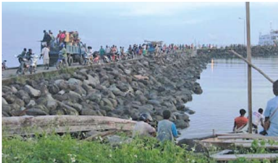
Gambar 3 : Pelabuhan Laut di Mansyoki (Kampung Saribi), P. Numfor