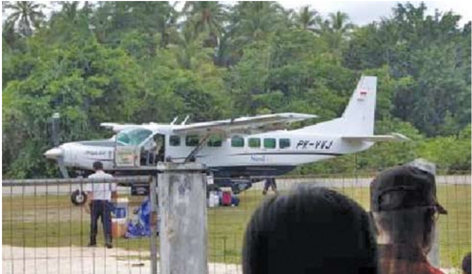
Gambar 2: Transportasi udara di bandara Yenburwo, Numfor

Lokasi penelitian yaitu di Kabupaten Biak Numfor, lebih khusus di wilayah pulau Numfor. Lokasi dapat dicapai melalui jalur laut dan udara. Untuk sampai di pulau Numfor, dapat melalui Biak (kota kabupaten), dengan kapal laut dan penerbangan perintis, dapat juga melalui kota Manokwari (provinsi Papua Barat). Bila melalui kota Manokwari, jarak yang ditempuh lebih dekat, baik lewat udara dan jalur laut. Tergantung mana yang hendak dipilih atau lebih disukai.