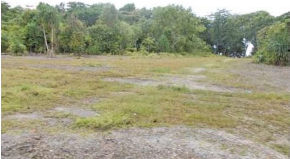
Satu dari tiga landasan pesawat peninggalan Perang Dunia II (Tidak dipakai lagi) Dokumentasi Tim : September 2013