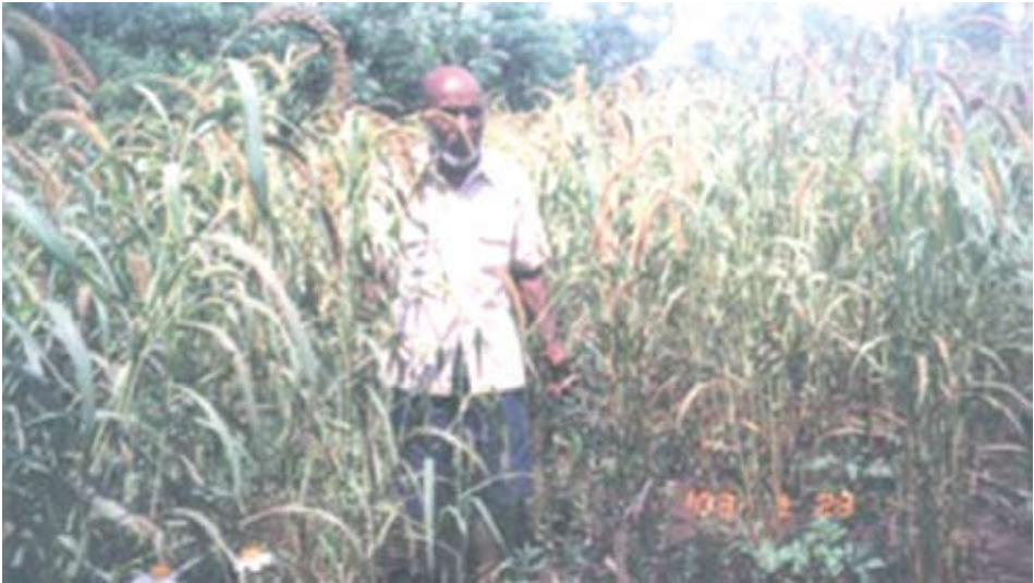
Gambar 10: Ladang pokem di Numfor

Sebelum bibit disebar, bisaanya ada tanda (semacam bentuk sasi atau larangan) berbentuk palang kayu. Artinya, areal atau lahan yang ada tanda palang tidak boleh diganggu atau tidak boleh dimasuki sembarang. Bila dilanggar, menurut kepercayaan dan pengalaman masyarakat bahwa si pelanggar akan dipagut ular, terkena penyakit, dan musibah lainnya. Selain itu, ada pondok-pondok yang dibangun di kebun untuk menjaga lahan agar tidak terganggu atau rusak oleh hal-hal yang tidak diinginkan. Ular juga turut berjaga-jaga selain manusia di pondok yang dibuat. Jenis ular yang menjaga kebun di dekat pondok adalah ular derik (ular pendek) disebut eknampu , dan ular putih panjang disebut epioper .