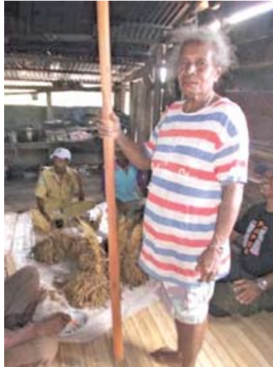
Salah satu alat tradisional menanam pokem Dokumentasi Tim : September 2013