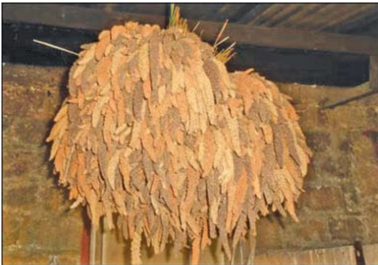
Tanaman Pokem yang sudah dipanen Dokumentasi Tim : Agustus 2013