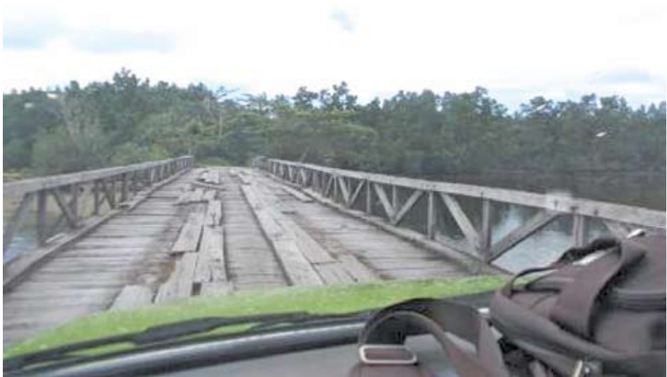
Satu-satunya jembatan penghubung antara distrik-distrik yang ada di Numfor bagian Barat dengan bagian Timur Dokumentasi Tim : Agustus 2013