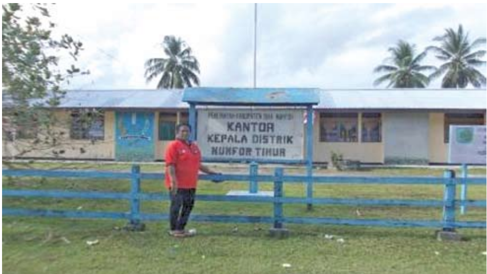
Kantor Distrik Numfor Timur, Kab. Biak Numfor Dokumentasi Tim : September 2013