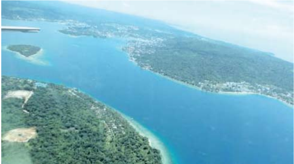
Kota Manokwari & Mansinam tampak dari atas pesawat dalam penerbangan dari Manokwari menuju Pulau Numfor Dokumentasi Tim : Agustus 2013