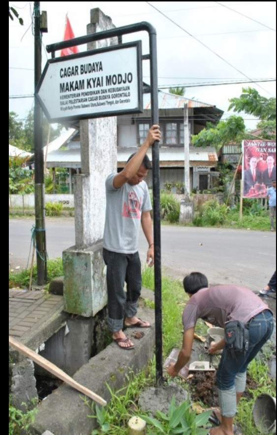
Pemasangan Papan Nama dan Petunjuk