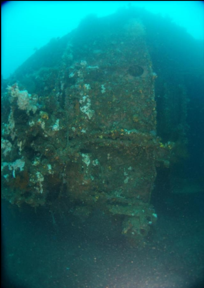
INVENTARISASI CB PERAIRAN BITUNG