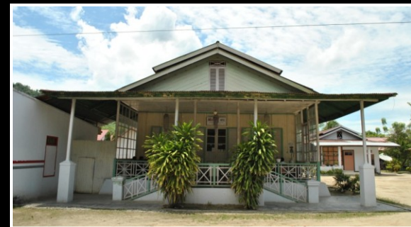
INVENTARISASI CB KOTA GORONTALO